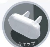
キャップ ※ オプション品